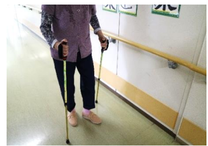
＜ポールウォーキング＞